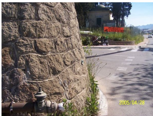
Le repère est au centre de la photo

Remarques : Exploitable par GPS depuis une station excentrée